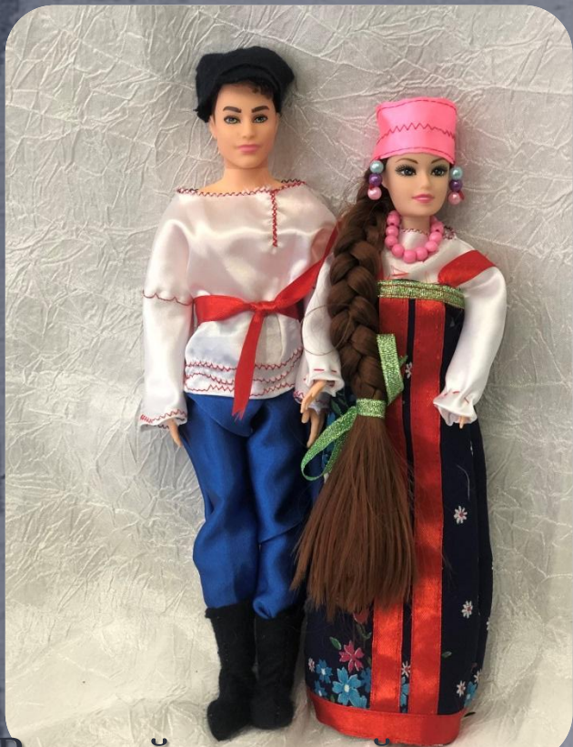
Русский северный костюм