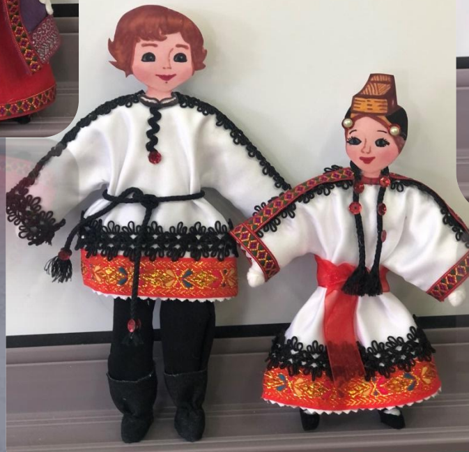
Русский южный костюм