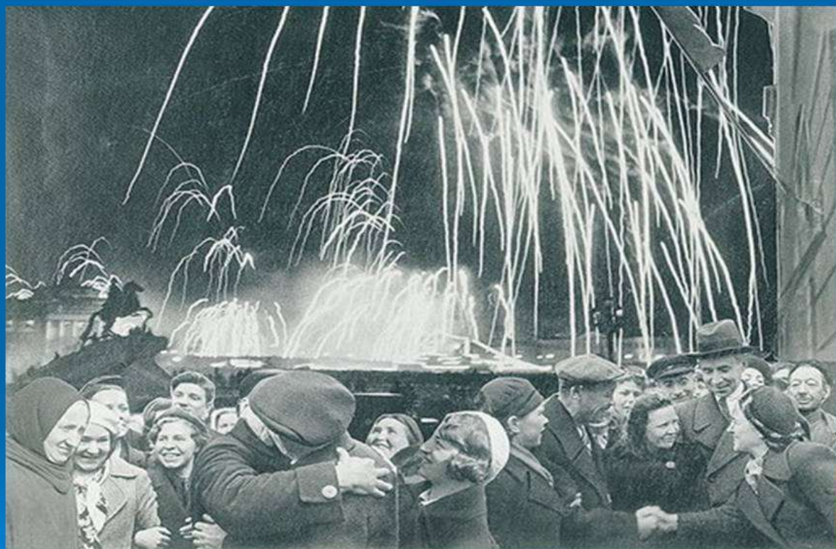
«ВЕЛИКАЯ ПОБЕДА ОДЕРЖАНА СОВЕТСКИМИ ВОЙСКАМИ ПОД ЛЕНИНГРАДОМ:

27 января 1944 года наши войска полностью освободили Ленинград от фашистской блокады. За город шли жестокие бои. За Родину солдаты воевали и в январе, разбив врага, кольцо блокадное прорвали.