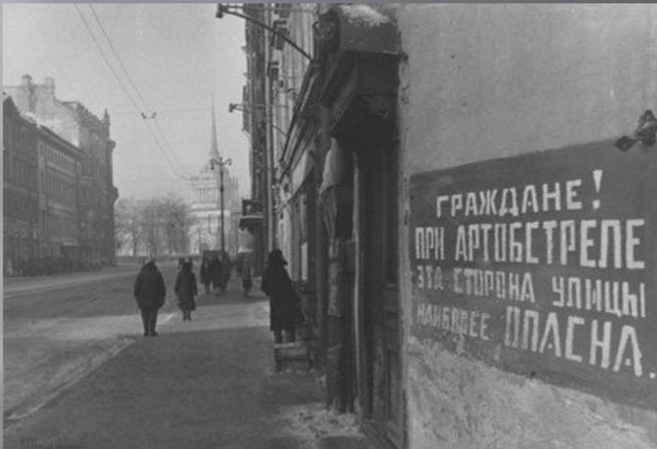
Охваченный войною Ленинград. На улицах трамваи замерзшие стоят. Разрушенные здания и надпись на стене: «Опасно при обстреле на этой стороне»