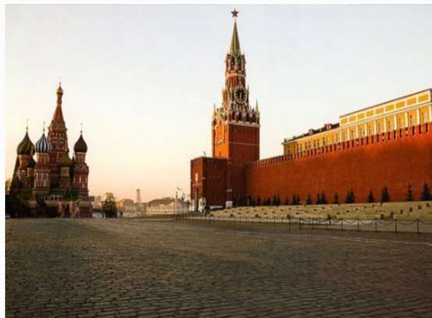
Город Москва — столица России (с 1918 года).