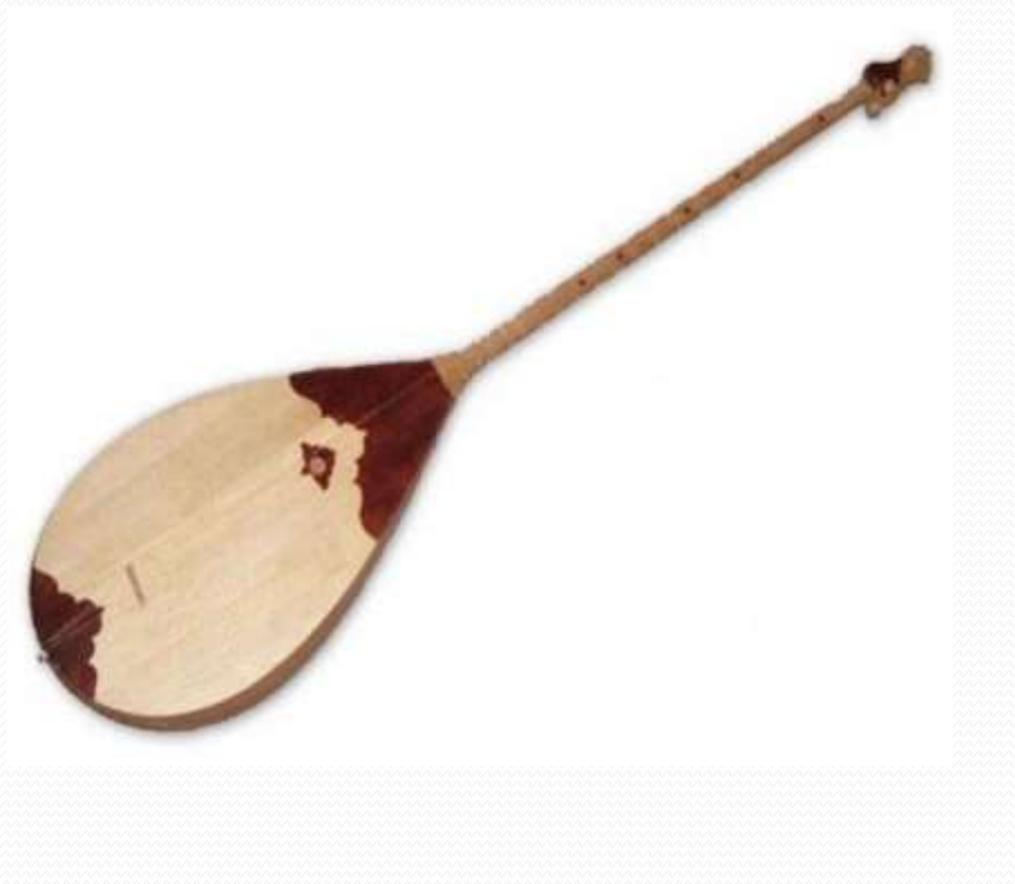
домбра - казахский национальный инструмент