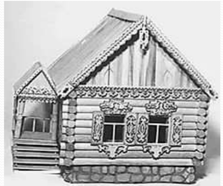
Изба - русское народное (национальное) жилище