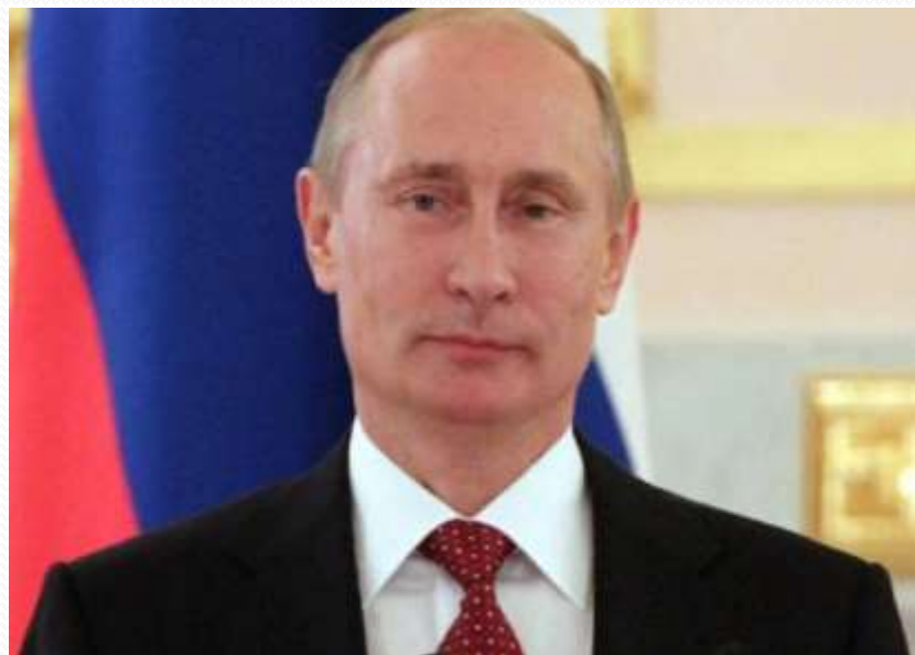
Президент России? – В.В. Путин