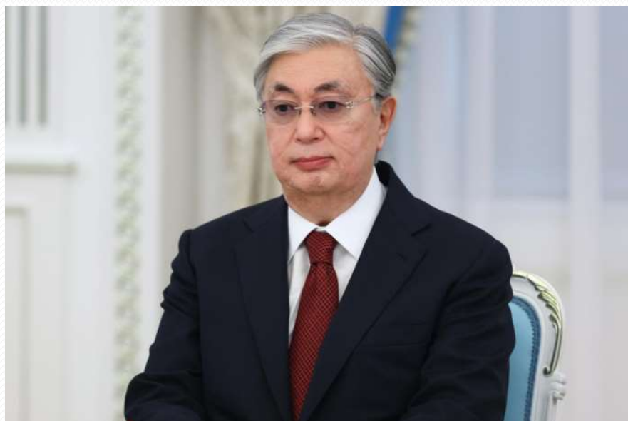
Президент Казахстана - К. Токаев