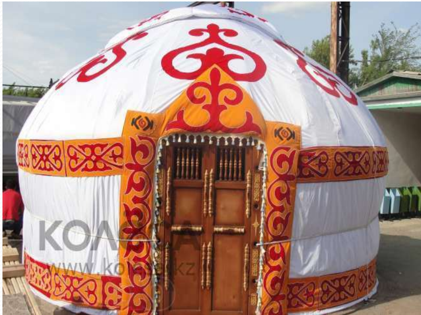
Юрта - жилище казахов - кочевников