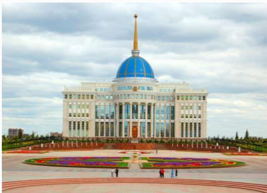
Город Астана — столица Республики Казахстан (с 1997 года).