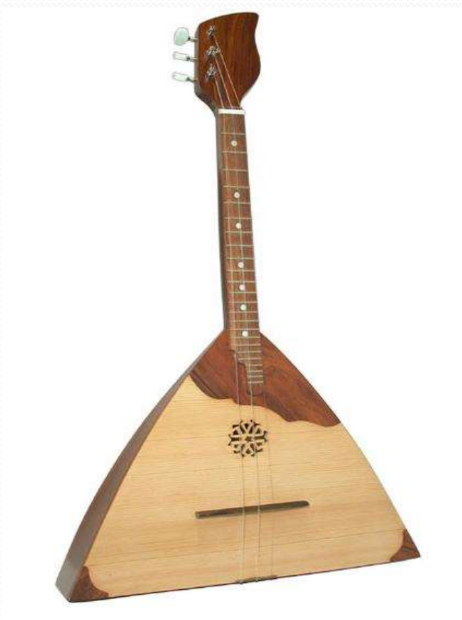
балалайка – русский национальный инструмент